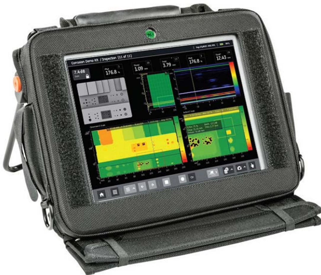
Рисунок 1 - Общий вид дефектоскопов

Общий вид дефектоскопов представлен на рисунке 1.