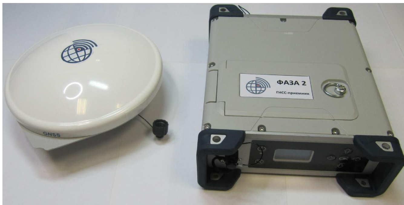
Рисунок 1 - Внешний вид аппаратуры геодезической спутниковой (ГНСС-приёмник) ФАЗА 2