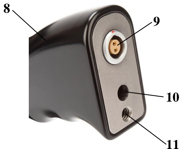
Рисунок 2 – Заряд батареи