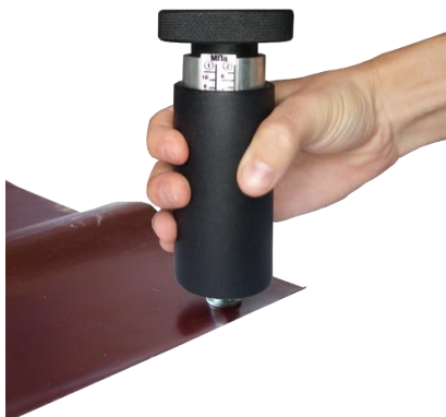
Рисунок 2.5 – Процесс наворачивания механизма на грибок