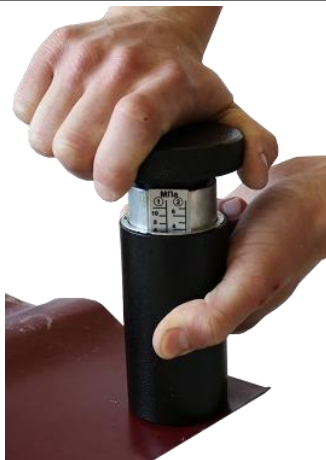
Рисунок 2.6 – Ввод пружины поворотного механизма