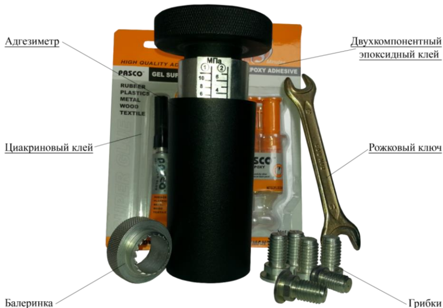
Рисунок 1.1 – Прибор и комплектующие