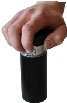
Рисунок 2.4 – Процесс отпускания захватного механизма