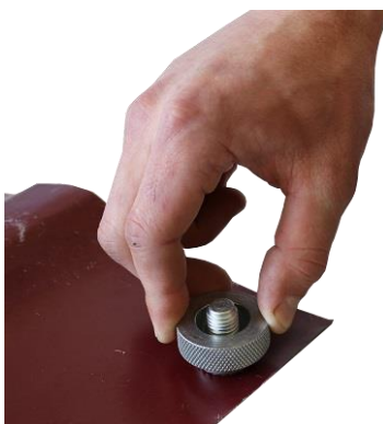
Рисунок 2.3 – Вырезание участка испытания