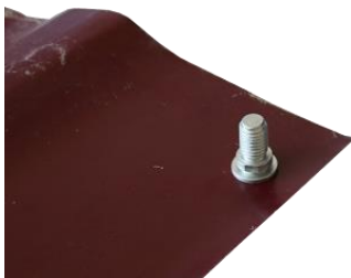
Рисунок 2.2 – Приклеенный грибок