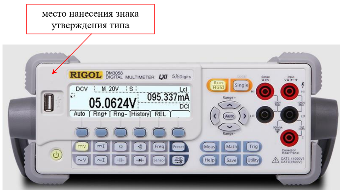
Рисунок 1 – Передняя панель Rigol DM3058